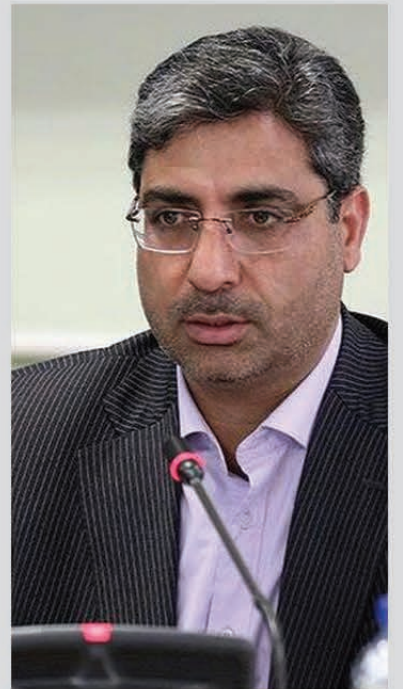
پیام معاون استاندار خراسان رضوی:

در دنیای رو به گسترش امروز و در عصر فن اوری های نوظهور که بیش از پیش، تغییر و تحول در تمام عرصه های کشورهای جهان در حال وقوع می باشد توجه به نظم مبتنی بر نتایج علمی و ثابت، فنون و تجربیات بشری، مقررات و نظام های لازم برای ایجاد هماهنگی و وحدت رویه، افزایش میزان تفاهم، تسهیل ارتباطات، توسعه صنعت، صرفه جویی در اقتصاد ملی، حفظ سلامت و ایمنی عمومی، گسترش مبادلات بازرگانی داخلی و خارجی به عنوان قاعده اصلی در نظام استاندارد محسوب می گردد.