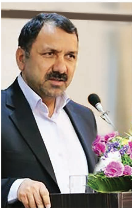
پیام مدیر کل استاندارد خراسان رضوی شعار سال ۲۰۲۰

((حفاظت از زمین با استانداردها)) امروزه استانداردها در همه اجزای زندگی بشری دخیل هستند. حضور مداوم استانداردها در زندگی محدود به کالاها و خدمات روزمره نمی شود بلکه حوزه های مهم و کلانی مثل انرژی، حمل و نقل و فناوری اطلاعات، حفاظت محیط زیست را نیز در بر می گیرد. برای ما و همکارانمان هیچ موضوعی مهمتر از ایمنی و سلامت مردم نیست و به همین دلیل با چشمان باز و هوشمندی بر تولید، واردات و صادرات کالاها و خدمات نظارت می کنیم و باور داریم که استاندارد کلید توسعه اقتصادی کشور است. ما با توجه و درک دغدغه های مقام معظم رهبری، برای تحقق شعار جهش تولید گام برداشته ایم و تمام توانمان را در جهت تحقق این هدف به کار خواهیم گرفت.