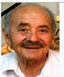
السلام عليك يا ابا عبدالله