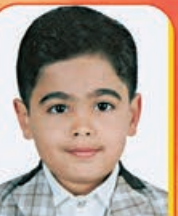
پناه‌فرسانی کلاس اول - مدرسه علوی خیلی خوب