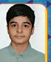
محمدز فزوانی کلاس ششم - مدرسه قدس ۲ خیلی خوب