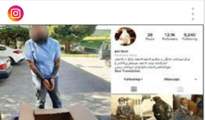
بچه شیر پر در دسر

ویدئویی از سه زن سارق طلا در شبکه های اجتماعی دست به دست شد که به گفته افسر پرونده آن ها در بازسازی صحنه جرم هم اقدام به سرقت طلا کرده بودند که بسیاری از حاضران در صحنه حتی متوجه آن هم نشدند. به گفته خبر نگاری که این گزارش را تهیه کرده متاسفانه به احتمال زیاد هنوز مال باخته گانی هستند که این سارقان از آن ها دزدی کرده و هنوز متوجه آن نشده اند. یکی از سارقان در حالی که چندین انگوی گران قیمت طلا در دست دارد دلیل سرقت ها را نداری بیان می کند که با واکنش خبر نگار مواجه می شود. کاربران هم به این ویدئو واکنش نشان دادند. کاربری نوشت: «واقعا خوبه که مغازه دار ها و طلافروش ها این جور سارق ها رو ببینن و با شکردها شون آشنا بشن تا شاید بیشتر مراقب باشن و تعداد پرونده های سرقت کمتر شه.»