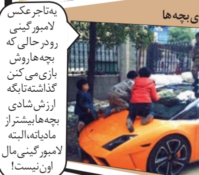
ارزش شادی بچه ها

به نظر م این یارو که با خلایقیت به همچین مطبی ساخته بایدتی و جاروش رو هم شبیه مسواک بسازه که جنش جور باشه!