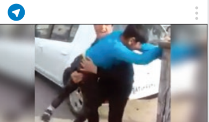
آزار برای دیده شدن!

گزارشی از وضعیت زباله هایی که پشت سدهای کشور انباشته شده در فضای مجازی منتشر شده که بازتاب زیادی داشت. در این گزارش از ۲۰ هزار تن زباله که تنها در پشت سدهای تهران شناور است و همچنین از خطراتی که ممکن است این زباله ها بر کیفیت آب شرب بگذارد، نوشته شده است. کاربران هم به این گزارش واکنش نشان دادند. کاربری نوشت: «این جا دیگه فلتش اتهام به سمت خود ماست و نمی توانیم هیچ مسئولی رو مقصر بدویم. این ماییم که زباله تولید می کنیم و بی محابا در طبیعت رها می کنیم و در نهایت شرش هم به خود ما بر می گرده.» کاربر دیگری نوشت: «تازه اینا از زباله هایی نوشتن که روی آب دیده میشه کلی زباله های سنگین داریم که بافتن زیر آب و دیده نمیشن.» کاربری هم نوشت: «از ماکه گذشت لاقال به فکر بچه هامون باشیم و بهشون یاد بدیم که به طبیعت احترام بذارن»