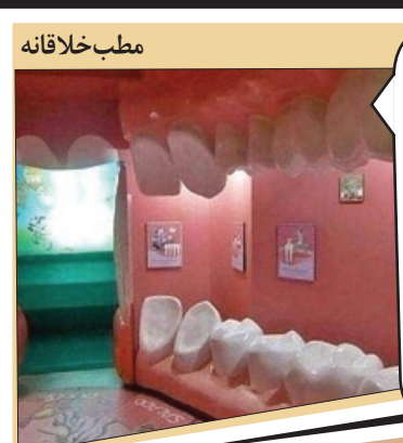
تصاویر پر باز دید فضای مجازی

به نظر م این یارو که با خلایقیت به همچین مطبی ساخته بایدتی و جاروش رو هم شبیه مسواک بسازه که جنش جور باشه!