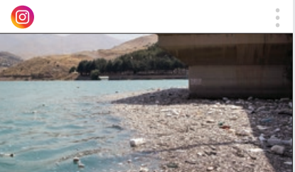
سدهای پر زباله!

قاچاقچی حیات وحش در فضای مجازی بچه شیر پر درد سری که علی خبری بود که بعد از ماجرای بچه شیر پر درد سری که علی زندوکلی را به چالش کشاند پر بازدید شد. چندی پیش علی زندوکلی خواننده کشور مان در صفحه اینستاگرام خود فیلمی را منتشر کرد که در آن یک توله شیر را بغل کرده بود و آن را می پوسید و در آن فیلم گفت که قصد دارد این توله شیر را نزد خود نگه دارد. این ماجرا با تاتاب زیادی داشت تا جایی که او را مجبور به پاک کردن ویدئو و عذر خواهی کرد. حالا اما فردی که در فضای مجازی اقدام به خرید و فروش گونه های جانوری می کرد، دستگیر شد. کاربری نوشت: «فیلم و سلفی گرفتن سلبریتی ها با حیوانات وحشی ناخواسته به نوعی تبلیغ قاچاق حیات وحش میشه و شاید عده ای رو تشویق به اون سبک زندگی کنه»