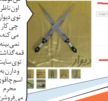
قمه فروشی در دیوار!

من موندم اون ناظر توی دیوار چی کار می کنه، نمی بینه قمه گذاشتن توی سایت و دارن به اسم چاقوی محرم می فروشن!