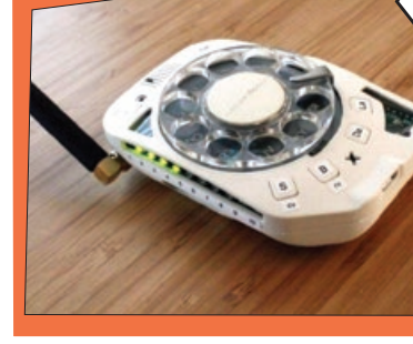
موبایل با شماره گیر دورانی

یه نفر تفریحی این موبایل رو طراحی کرده و توی وبسایتش گذاشته و کلی براش مشتری پیدا شده و حالا می خواد تولید انبوه کنه!