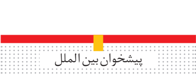
پیشخوان بین الملل