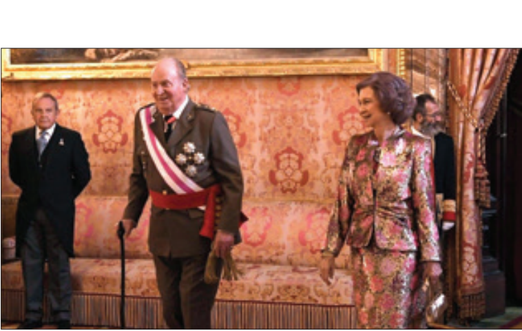
۱۵ ذی‌الحجه ۱۴۴۱. شماره ۲۰۴۴۳

پادشاه سابق اسپانیا به‌خاطر دریافت رشوه از سعودی به تبعیدی خود خواسته می‌رود