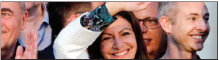
حزب ما کرون در انتخابات بی رمق شوراهای شهر فرانسه نا کام ماند

توافق صلحی که قرار بود برای افغانستان آرامش و ثبات به همراه آورد، اما حالا گویا به تشدید تنش ها و ناامنی های داخلی در افغانستان منجر شده است. در تازه ترین تنش ها و درگیری ها در مناطق مسکونی پیرامون دام در ولایت هلمند این کشور هدف حمله راکتی قرار گرفت که در نتیجه آن دست کم ۲۵ غیرنظامی کشته و ده ها نفر دیگر زخمی شدند. هم طالبان و هم دولت افغانستان یکدیگر را از بابت وقوع این حمله که علیه یک دوشنبه بازار مخصوص فروش دام در منطقه "سنگین" واقع در ایالت هلمند صورت گرفت، مقصر دانستند. در این محل صدها روستایی از مناطق مجاور برای فروش دام هایی نظیر گوسفند و بز تجمع کرده بودند. برخی ساکنان