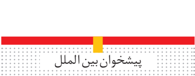
پیشخوان بین الملل