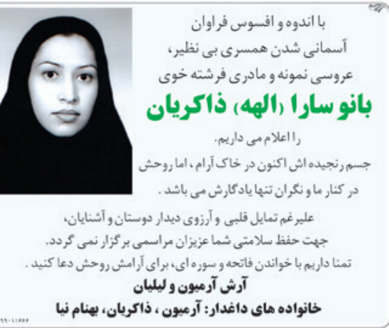
با اندوه و افسوس فراوان