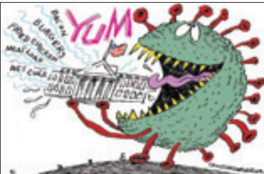
سرانجام دولت ترامپ

بحران سیاسی اسرائیل پس از برگزاری سه دور انتخابات پارلمانی به پایان رسیده و دولت جدید این رژیم با رأی اکثریت پارلمان (۷۳ مقابل ۴۶ رأی) کار خود را به زودی آغاز می کند. تمام این ها اما در حالی است که بنی گانتس، وزیر جنگ جدید رژیم صهیونیستی متعهد به تلاش برای حمایت از اجرای طرح به اصطلاح صلح آمریکا موسوم به «معامله قرن» شد. بر اساس توافقی که نتانیاها با بنی گانتس، رهبر حزب آبی-سفید انجام داده، رهبر حزب راست گرای لیکود در ۱۸ ماه آینده ریاست دولت را به عهده خواهد داشت و پس از آن زمام امور را به گانتس خواهد سپرد. نتانیاها در دوران ریاست گانتس، وزیر جنگ خواهد بود. این پست در ۱۸ ماه آینده در اختیار گانتس است. شبکه الجزیره با