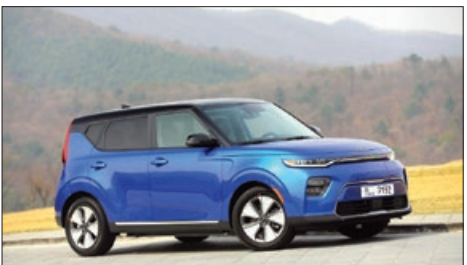
کیا تلور اید برای ۸۶ داور از ۲۴ کشور بهترین ماشین سال ۲۰۲۰ شد

کارخانه‌ها هم با رعایت موازین ایمنی فعالیت خود را از سر گرفته‌اند. تب کارگران هنگام ورود به کارخانه اندازه گرفته می‌شود، آن‌ها باید همیشه ماسک به صورت داشته باشند و با فاصله از یکدیگر کار کنند.