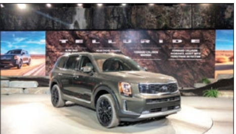
کیا سول الکتریکی بهترین ماشین شهری سال ۲۰۲۰ شد