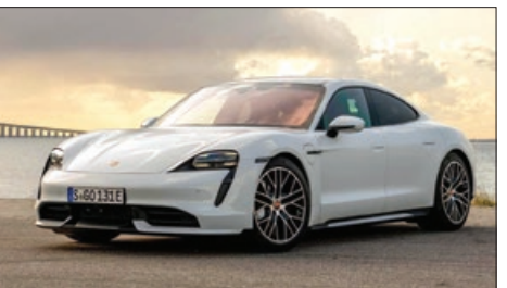
پورشه تایکان در ۲ بخش بهترین ماشین اسپرت و بهترین ماشین لوکس سال برنده شد