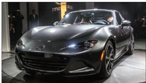
مدل ۷۳۱ برنده جایزه بهترین طراحی سال ۲۰۲۰ شد

گفته می‌شود این ماشین با دو موتور الکتریکی بیش از ۶۵۰ اسب بخار نیرو تولید و با هر بار شارژ تا ۶۴۰ کیلومتر حرکت می‌کند. قدرت موتور سری ۷ با موتور ۱۲ سیلندر ۶۰۰ اسب بخار است.