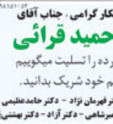
دوست و همکار گرامی، جناب آقای