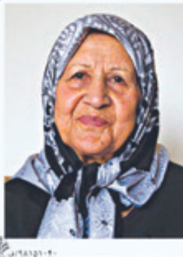
با کمال تأسف و تأثر درگذشت مادر عزیزمان