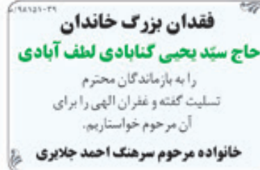
فقدان بزرگ خاندان