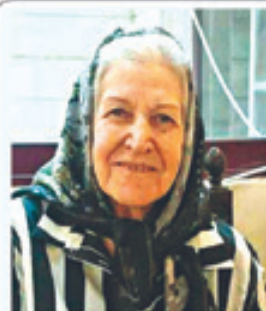
با نهایت تأسف و تأثر