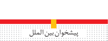
پیشخوان بین الملل