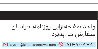
واحد صفحه‌آرایی روزنامه خراسان

آمریکا از اشرف غنی خواسته است که به دلیل اختلاف موجود بر سر رای نهایی کمیسیون مستقل انتخابات و نیز به خطر نیفتادن مذاکرات صلح و واشنگتن و طالبان، مراسم تحلیف رئیس جمهور ی افغانستان را به تعویق ببندازد. این درخواست در حالی مطرح می‌شود که عبدا... عبدا...، رقیب اصلی محمد اشرف غنی، نتیجه تایید شده را «غیر قانونی» توصیف کرد و ضمن تهدید امنیت خود تصریح کرده بود که قصد دارد «حکومت همه شمول» تشکیل دهد. نکته قابل توجه این است که تاریخ برگزاری مراسم تحلیف عبدا... دقیقاً با مراسمی که قرار است برای ادای سوگند محمد اشرف غنی، رئیس جمهوری منتخب افغانستان برگزار شود، هم‌زمان شده است. مقامات ارگ البته ویروس کرونا و کمبود وقت را دلایل این تعویق اعلام کرده‌اند.