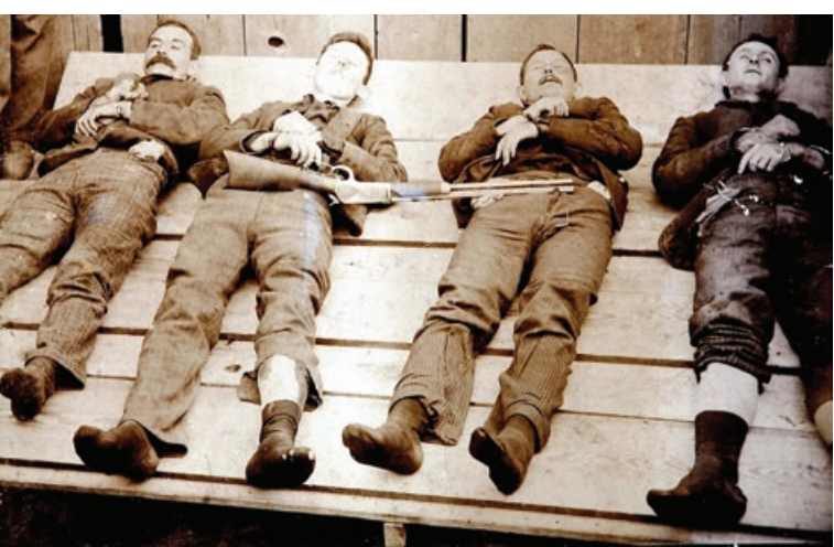
اجساد اعضای باند برادران دالتون که طی قرن ۱۹ در آمریکا وحشت می‌آفریدند

این مناطق، سرعت در کشیدن اسلحه، حرف اول را در بقای افراد می‌زد و به این ترتیب، اسطوره‌های هفت تیر کشی در غرب ظهور کردند؛ همان‌هایی که بعدها به دستمایه ساخت فیلم‌های وسترن تبدیل شدند.