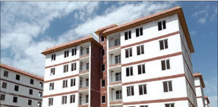
ساختمان آپارتمانی جدید

به گزارش خراسان، بانک ها طی سالیان و در مقام یک بنگاه دار، بخشی از سرمایه گذاری های خود را در املاک انجام دادند. با این حال، ر کود بخش مسکن در سال های گذشته از یک سو و وجود گسل بین دارایی و بدهی بانک ها از سوی دیگر به این منجر شد که فروش اموال مازاد بانک ها در صدر توجهات قرار گیرد. در این باره هفتم دی ماه ۹۳، مجلس همه بانک ها و موسسات اعتباری را مکلف کرد در مدت سه سال اموال منقول و غیر منقول مازاد و سهام تحت تملک خود را در بنگاه هایی که فعالیت غیر بانکی دارند و اگذار کنند. با این حال، بانک ها در اجرای آن تعلل کردند. در ادامه بانک مرکزی در دولت دوازدهم، برنامه اصلاح بانکی را در اولویت قرار داد که در صدر آن موضوع خروج بانک ها از بنگاه داری طی سه سال مطرح شد. مجلس نیز این بار ذیل قانون رفع موانع تولید بسترهای قانونی این طرح را