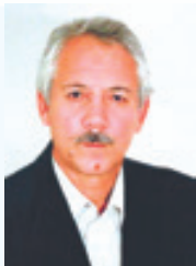
بازگشت همه به سوی اوست