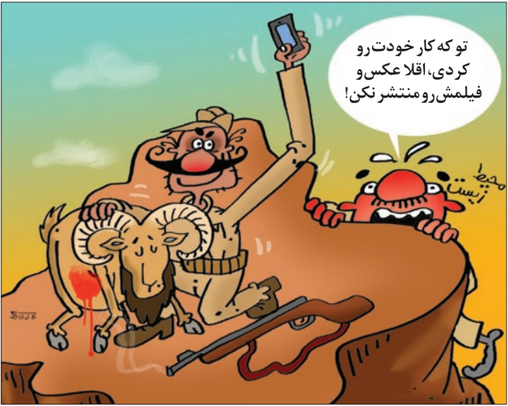
کار نویسند: علی کاظمی

ای صاحب فال، از عذر خواهی کردن نترس، فوقش طرف نمی پذیرد و یک چیزی می گوید و تو هم جوابش را می دهی و بعد باز عذر خواهی می کنی!