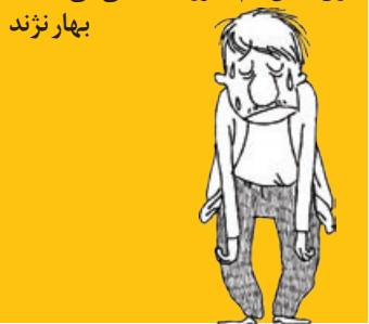
کار نویسند: مسعود هاشمی

همسر مرا بار جیبم را که خالی می کند هی مرا در گیریک بحران مالی می کند هر چه می گویم که ول کن جیب بی پول مرا ول کنش هم لا مروت اتصالی می کند!