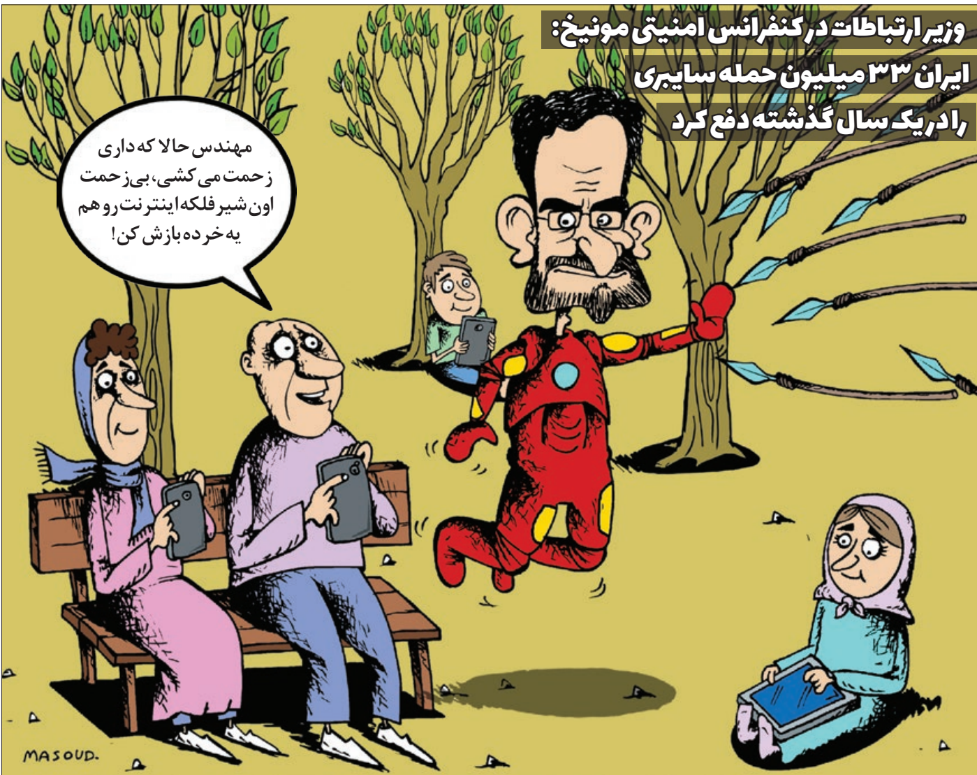
کار نویسند: مسعود هاشمی